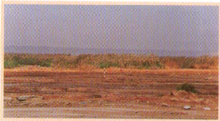
محمية شرق الجهراء

أما بالنسبة للنباتات فبالإضافة إلى مفترش البوص (Phragmitesaustralies) هناك غابة الأثل (Tamarex) التي زرعت في الخمسينات في منطقة الجهراء وتقع ضمن إطار المحمية . كذلك هناك مجتمعات من النباتات العصرية الملحية مثل ( Zygophillum Halexleon ) إجراءات الحماية : تم تسوير المحمية بسياج ورسمت حدودها بلوحات إرشادية تمنع غير المخولين بالدخول والعبث بها كذلك توجد حراسة مستمرة لمدة ٢٤ ساعة يومياً .